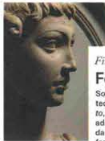
Busto di giovane uomo (1435-40) di Luca della Robbia.